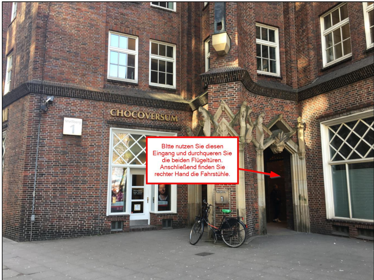
Abbildung 3 Nahaufnahme des Eingangsbereichs am Meißberg 1